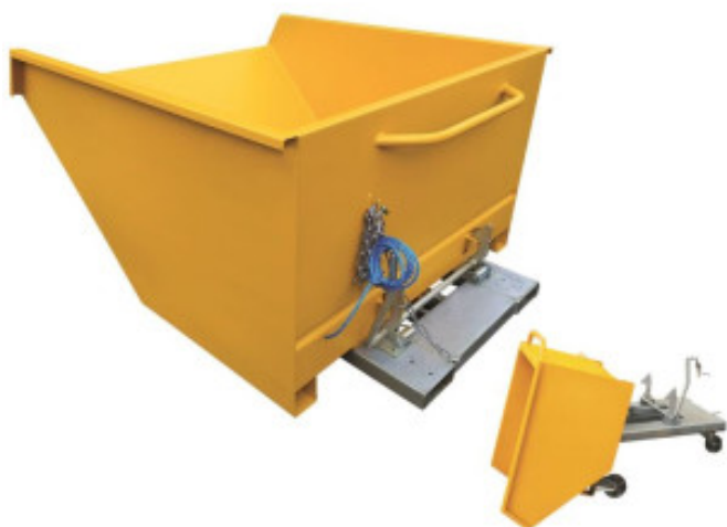
BENNE SURBAISSEE DE 180 LITRES

Environ 3 à 4 semaines - A confirmer lors de la commande